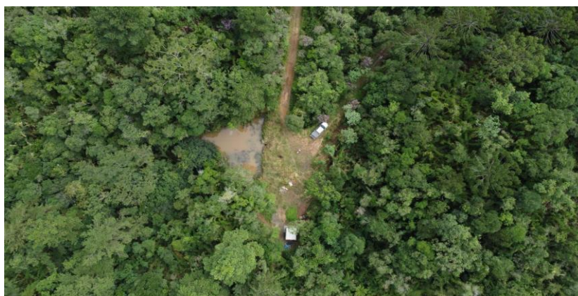
sanitários na trilha RPPN

Para melhor conforto aos visitantes da RPPN Monte Sinai, foi construído dois sanitários com sistema de biodigestor da trilha interna, sendo previsto a construção de outros dois sanitários em 2023.