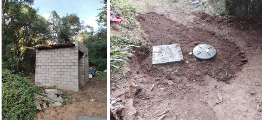
biodigestor (sistema dos sanitários da trilha RPPN)