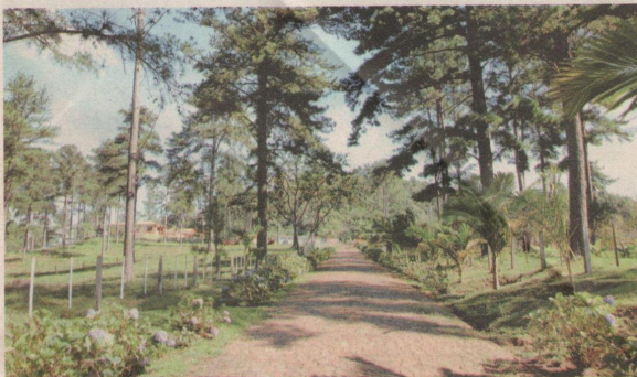
Fazenda Monte Sinai, em Mauá da Serra, é modelo na região

ENVIE SEU COMENTÁRIO editor@tribunadonorte.com